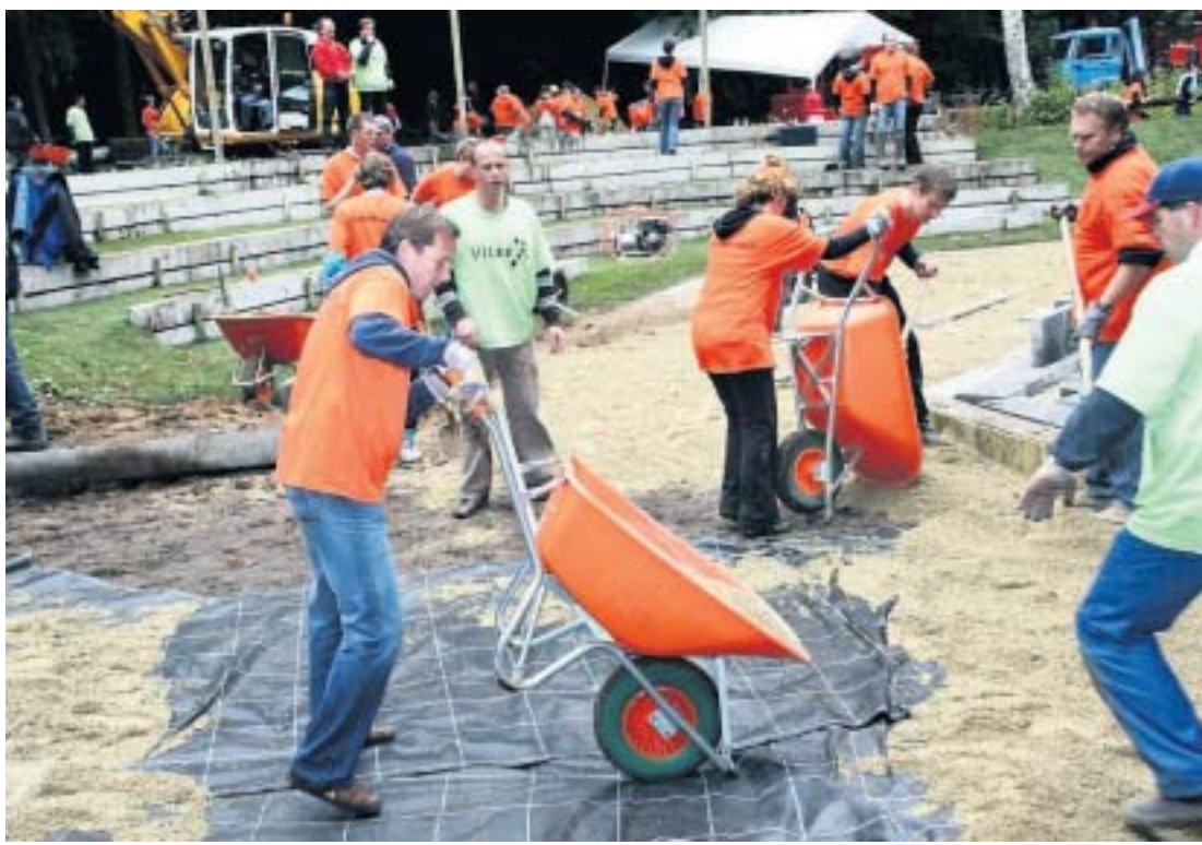
Medewerkers van Vitae leggen belangeloos een amfiteater aan op het terrein van de Jeugdorp Laanzicht, een instelling voor maatschappelijke jeugdzorg in het Brabantse Teteringen.

Vitae bemiddelt mensen van hbo- en mbo-niveau naar hun eerste baan of een volgende stap in hun loopbaan. „Reputatie speelt in ons werk een grote rol. Zo'n 70 procent van de werving en selectie gaat via ons netwerk”, zegt Oldenboom. Daarnaast detachereert Vitae jaarlijks duizenden mensen bij bedrijven. „Ze zijn bij ons in dienst en wij zoeken passende klussen voor ze. Het gaat niet om mensen op topniveau, want we zijn geen headhunters. We richten ons in het hele land op de grote midden-groep voor werk in het MKB (midden- en kleinbedrijf, red.). Alleen zijn we geen uitzendbureau die schoonmakers en mensen voor werk aan de lopende band levert. Onze aanpak is puur lokaal. In Utrecht gaan we in de slag met Utrechtse bedrij-